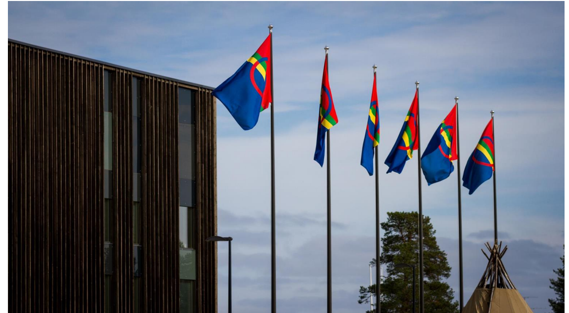
Kuva: Saamelaiskäräjät – Sámediggi | Jan-Eerik Paadar/ Ijahis Idja